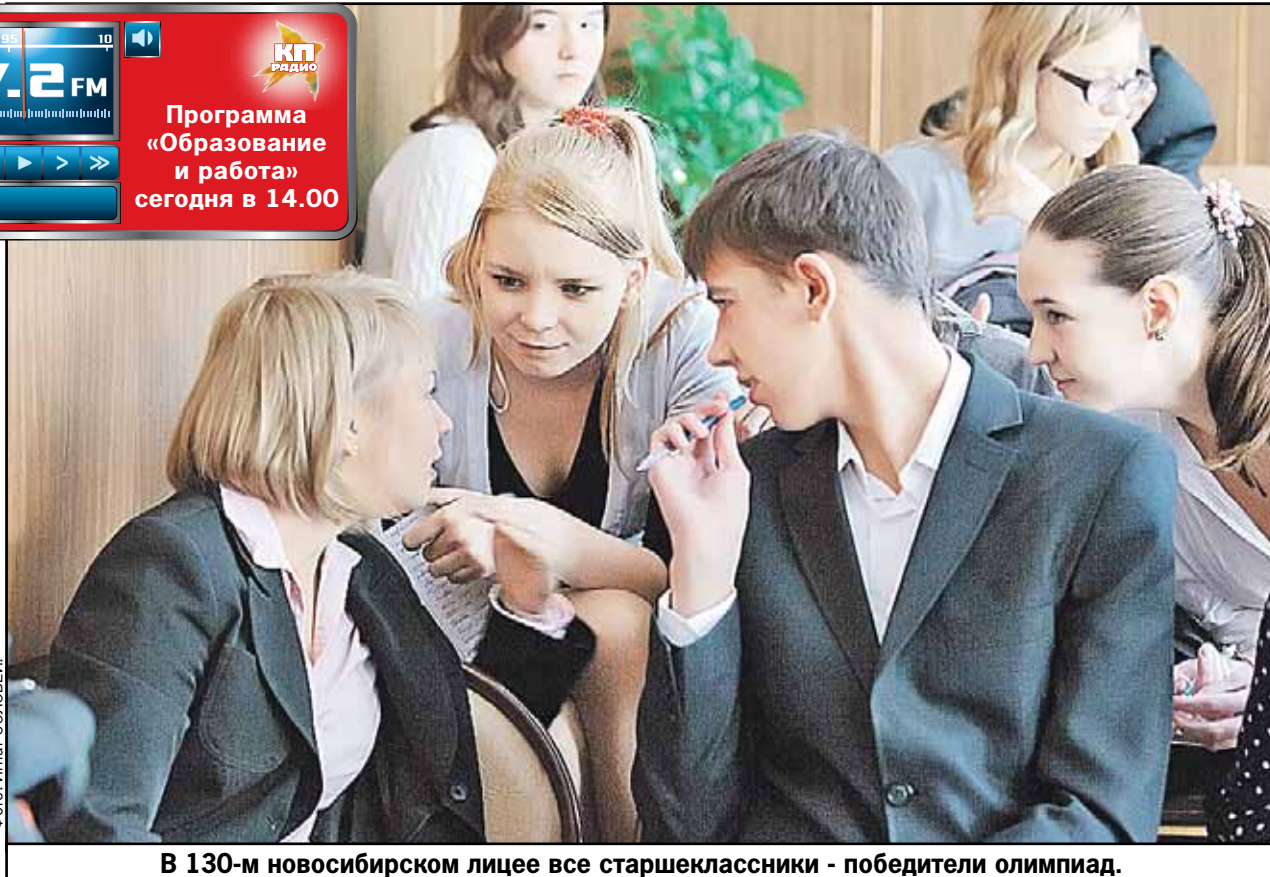
В 130-м новосибирском лицее все старшеклассники - победители олимпиад.

пять аспирантов. Он просто вынужден был придумать для них интересные темы диссертаций. Этот поиск привел к тому, что ему присудили премию Филдса, аналог Нобелевской.