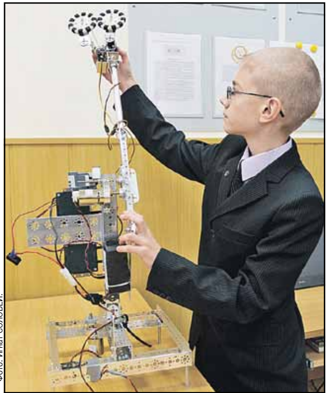
Этот юный талант уже учится в девятом классе и теперь «дрессирует» робота.

Наверное, именно последнее можно назвать самым важным качеством педагога. Иначе другие пункты, такие как отбор способных учеников и специальная подготовка, не приведут к желаемому результату. Ну а умение сочетать сразу все ключевые моменты - это высший пилотаж. Похоже, новосибирские школы овладели этим искусством в полной мере.